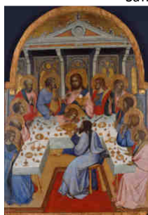
I - L'Ultima Cena Agnolo Gaddi