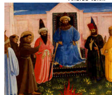
L - La prova del fuoco di San Francesco Fra Angelico