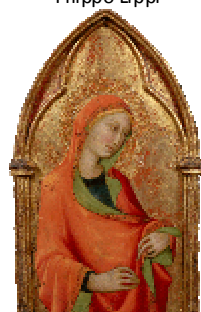
N - Santa Maria Maddalena Lippo Memmi