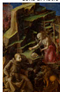
K - San Geronimo penitente Filippo Lippi