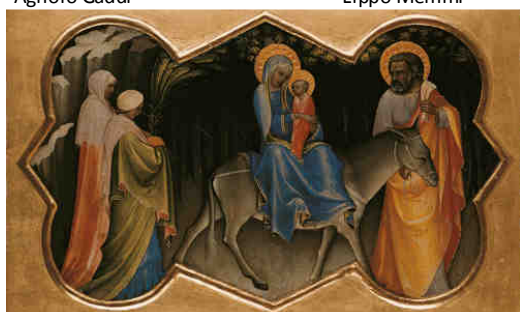
M – Fuga in Egitto Lorenzo Monaco