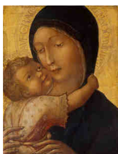
B - Vergine con il Bambino Liberale di Verona