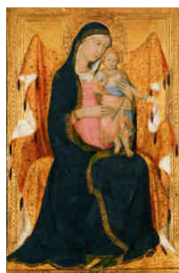
J – Vergine con il Bambino Lippo Memmi