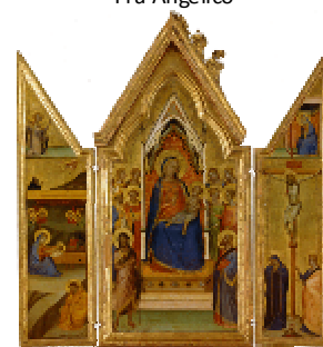
O - Trittico con la Vergine in maestà Bernardo Daddi