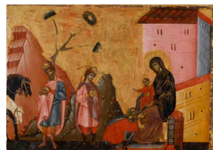
E – Adorazione dei Magi Guido da Siena