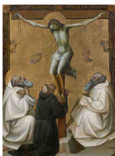
C - Cristo Crocifisso Lorenzo Monaco