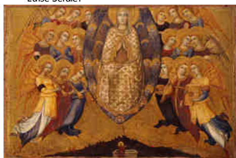
F - L'Ascensione della Vergine Sano di Pietro